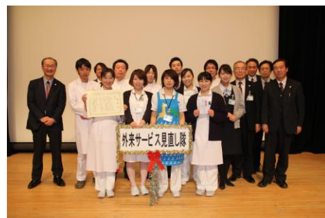
優秀賞 外来サービス見直し隊