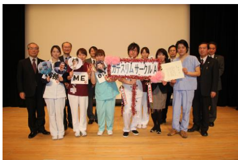
優秀賞 カテスリム サークル A