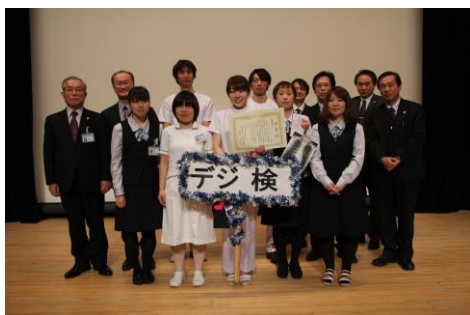
最優秀賞 デジ検チーム